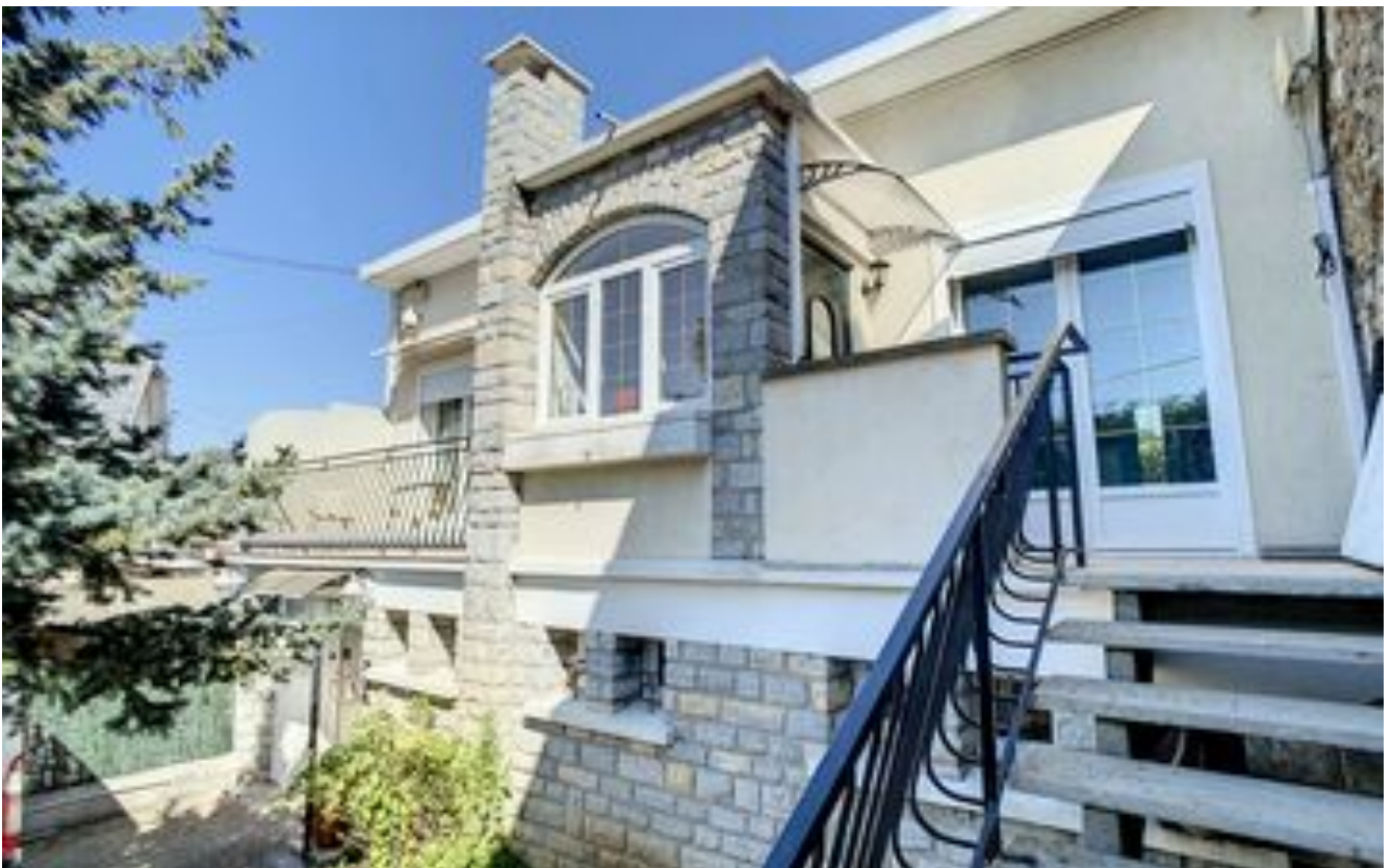
Immobilier : où acheter une maison à moins de 1h30 de Paris ?